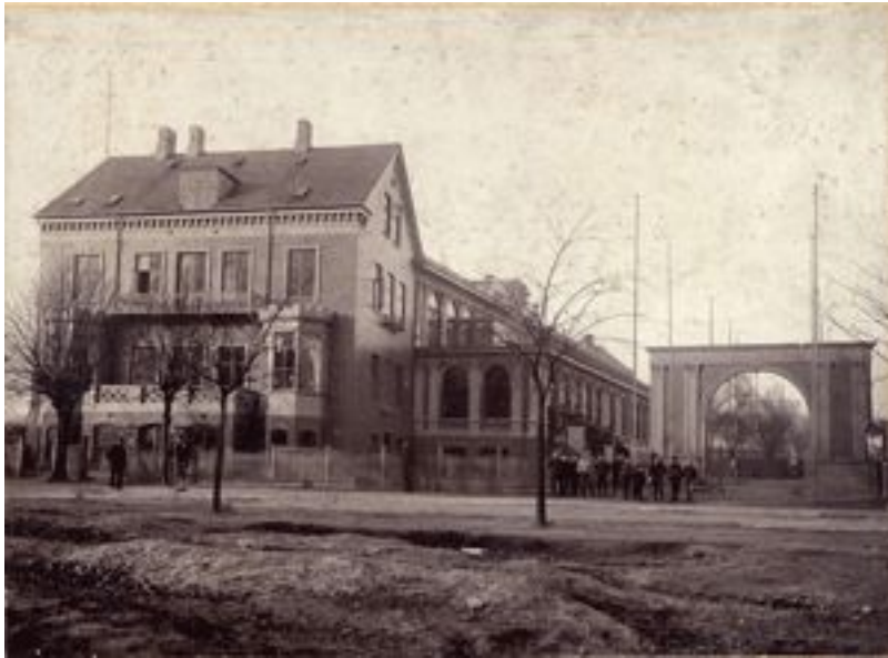
Folkets Hus som det så ud udefra i 1898. I 1959 blev et nyt Folkets Hus indviet på samme sted. Det er i dag musikhuset Vega. (ABA)