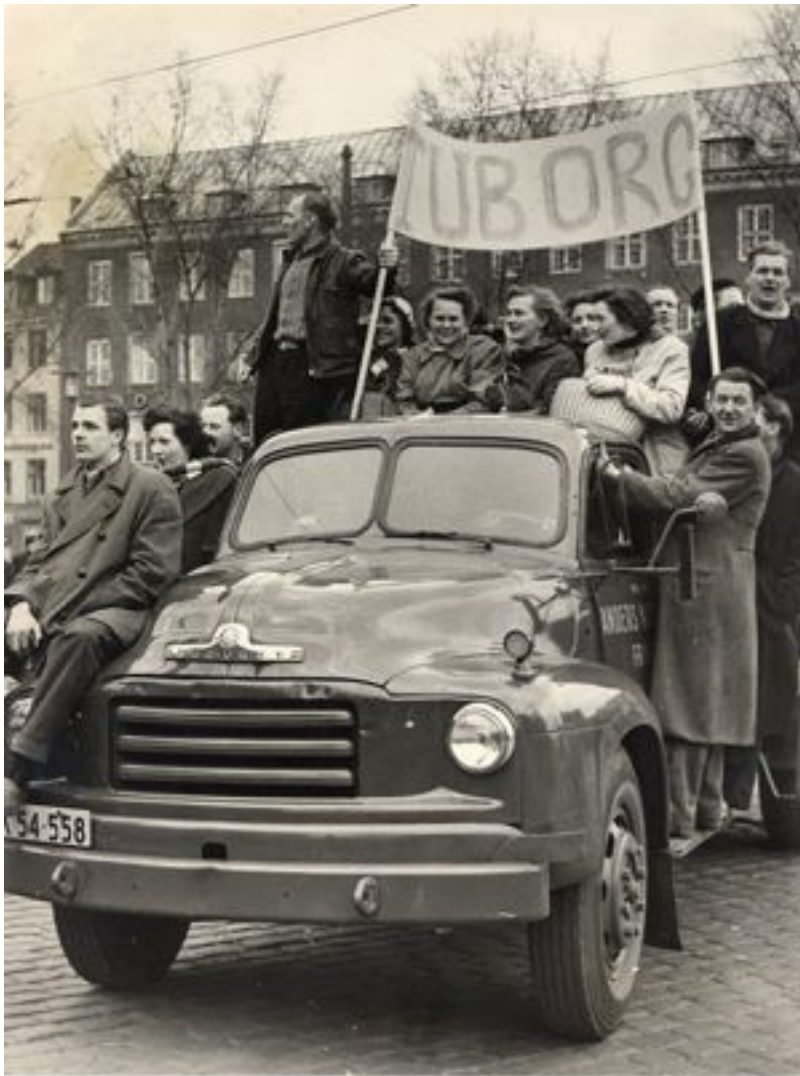
Arbejdere fra Bryggeriet Tuborg markerede, at de havde sluttet sig til strejken i 1956, ved at drage til Christiansborg Slotsplads.

Et nyt kapitel blev i 1960 skrevet da LO, som DsF siden 1967 havde kaldt sig, indgik en ny hovedaftale med Dansk Arbejdsgiverforening. En aftale der betød at der indførtes ændringer i Septemberforliget fra 1899. Et afskedigelsesnævn oprettes og erstatning svarende til 13 ugers løn ved ubegrundet fyring indførtes.