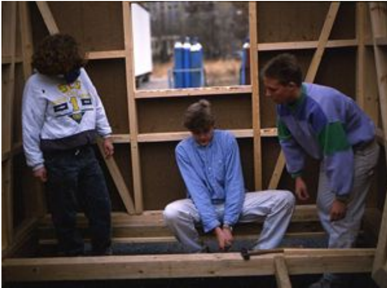
Lærlinge på snedker- og tømrerlinjen på Efg-skolen på Rentemestervej i København.

Det udviklende arbejde og Retten til fremtiden var begge meget ambitiøse uddannelsesoplæg, som LO kom med i 1990erne.