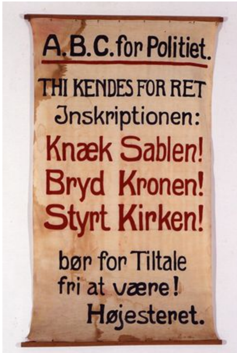
Slagordene på SUF's bannere var tydelige nok: de var for fred men mod kongedømmet og kirken. Deres provokationer kom for Højesteret, men de gik fri.