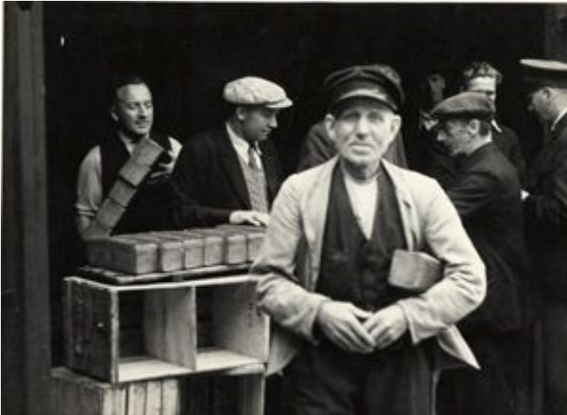
Brøddeling under Folkestrejken i 1944.

1920erne og 30erne havde knyttet Socialdemokratiet og fagbevægelsen stærkt sammen. Parløbet med Socialdemokratiet tog tydeligere og tydeligere form og samarbejdet fortsatte under besættelsen, som blev en vanskelig tid både for fagbevægelsen og for Socialdemokratiet.