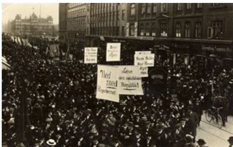
Det samtidige politiske modstykke til fagoppositionen var den socialdemokratiske ungdomsbevægelse, SUF, der her ses i en 1. maj demonstration 1915. (ABA)

Indførelsen i 1920 af 8-timersdagen, der havde været kampparolen siden den allerførste 1. maj-dag i 1899, blev en sejr for syndikalisterne og deres kamptaktik. Nedsættelsen af arbejdstiden til 8 timer om dagen blev nemlig fremskyndet af en strejke i de københavnske byggefag i 1919.