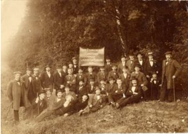
Bygnings-snedkere der sender solidaritetshilsner hjem fra Christiania, i dag Oslo, til deres kammerater i Danmark under Storlockouten i 1899. (ABA)

Det var ved overenskomsten, der blev indgået ved Septemberforliget, at regler for varsling af strejker og lockouter blev fastlagt og en fredspligt blev indført. Fredspligten betød, at organisationer ikke måtte støtte konflikter i overenskomstperioden.